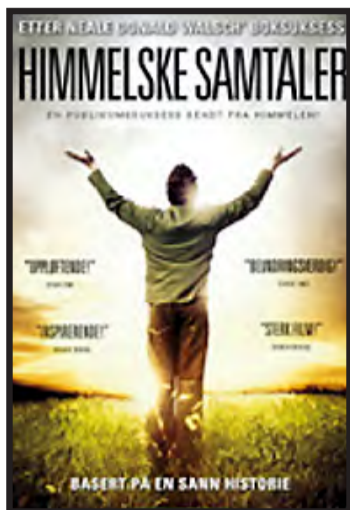
SPILLEFILM: Det er laget spillefilm om Walsch.

For lite søvn kan også lede til: ■ Uro på skolen ■ Vansker med å tilegne ny kunnskap ■ Flere konflikter med foreldre ■ Svekket vurderingsevne (Kilde: Helsenett.no)