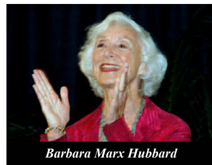
Barbara Marx Hubbard

Som avslutning vil jeg ta med, at i dette fascinerende aspektet – ”fødselen” av den nye Menneskeheten, er vi ”både moren og barnet”. Vi er selv både skaperen og det vi skaper! Gå ikke glipp av denne spesielle biografien, og all visdom fra Barbara Marx Hubbard, ført i pennen av en spirituell forfatter, som de fleste kjenner til - Neale Donald Walsch!